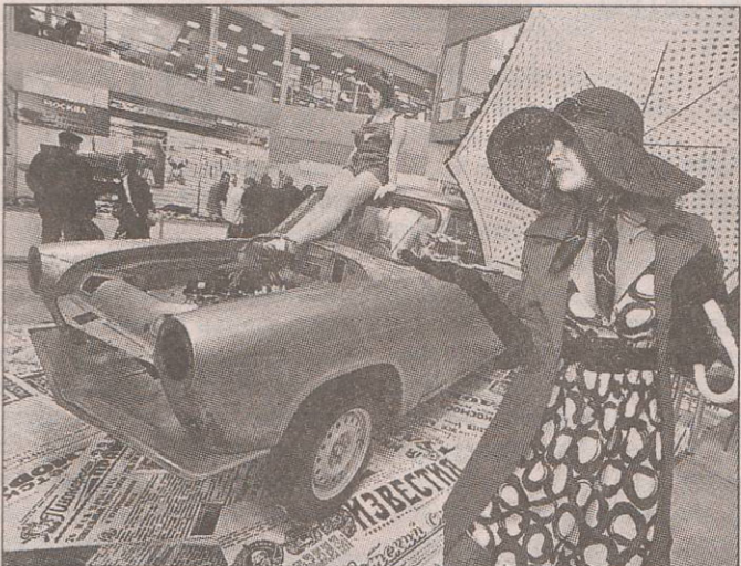
■ Девушки машинам старались соответствовать